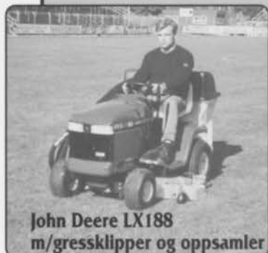
John Deere LX188 m/gressklipper og oppsamler