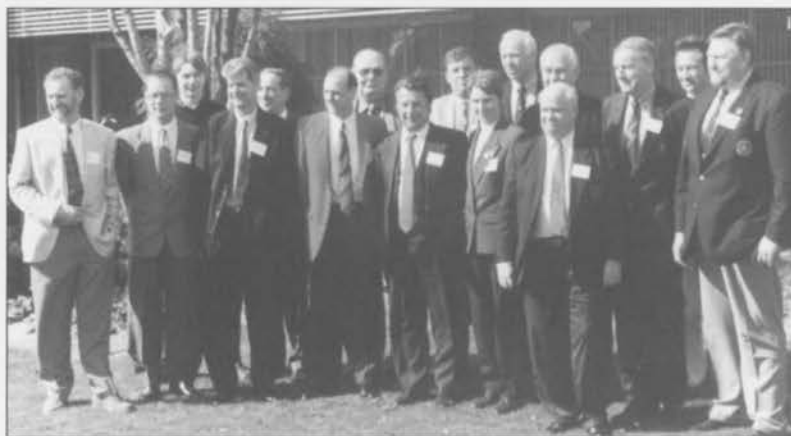
Alle deltakerne utenfor Mommerstigs lokaler.