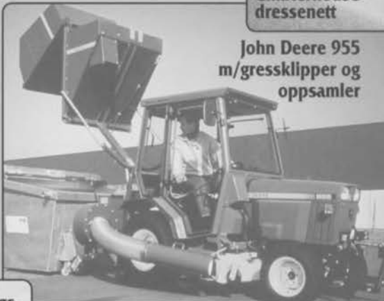
John Deere 955 m/gressklipper og oppsamler