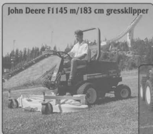
John Deere F1145 m/183 cm gressklipper